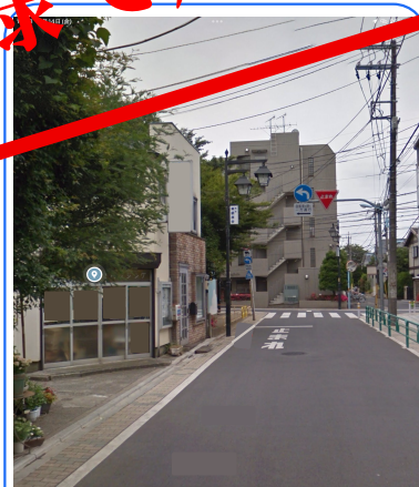
駅より神明通り角の西荻南児童公園手前