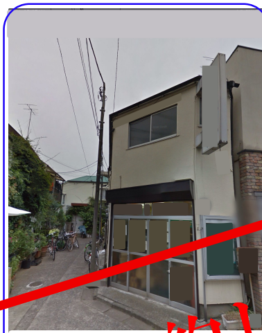
区立西荻南児童公園より店舗正面を撮る